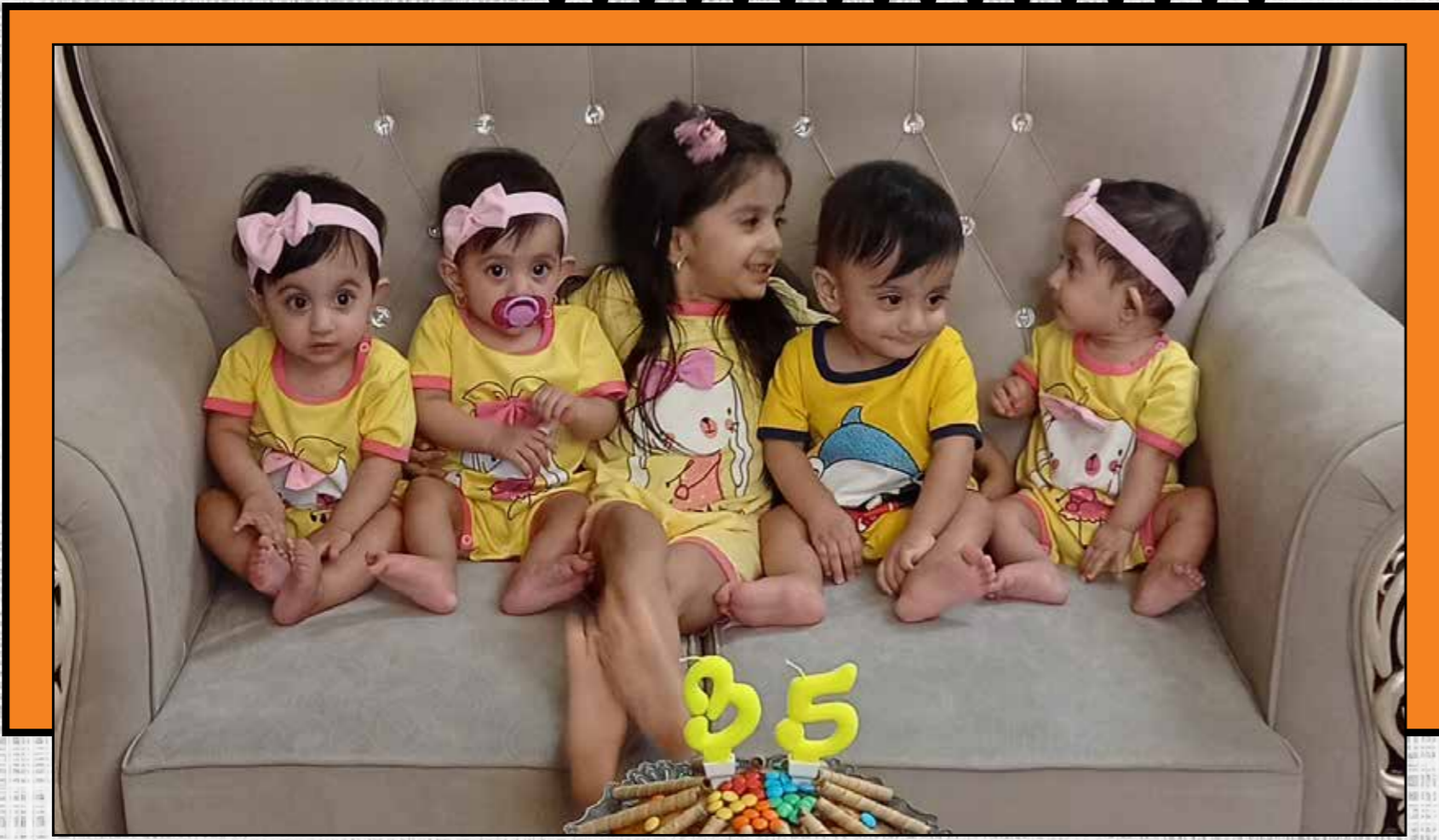
خاطره مادرانه سه