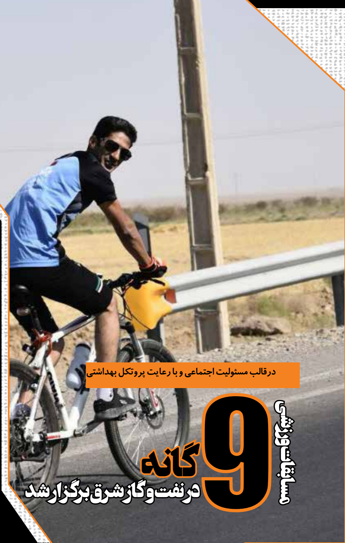
در قالب مسئولیت اجتماعی و با رعایت پروتکل بهداشتی