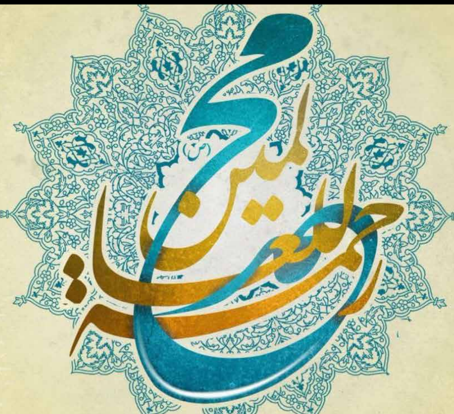
محورهای اساسی سبک زندگی پیامبر اکرم(ص) (بخش سوم)

می‌توان گفت برای رسیدن به معیارهای صحیح ازدواج اسلامی باید جوانان در راه کسب تجربه و شناخت و آگاهی بیشتر، با افراد آگاه مشورت کنند و کتب مفیدی که در این زمینه نوشته شده است را بیخوانند، بین ملاک‌های واقعی و غیر واقعی تمایز قائل شوند و خود را اسیر معیارهای خیالی و خود ساخته و خرافاتی نکنند. تجملات و توقعات بیش از اندازه را کنار بگذارند و واقعیات را آنگونه که هست، بپذیرند. مهریه‌های سنگین را قبول نکنند، به اخلاق و رفتارهای مطلوب و ارزشی بهای بیشتری بدهند و زندگی مشترک خود را بر پایه‌های صداقت، صمیمیت، احترام و محبت بنا گذاری کنند