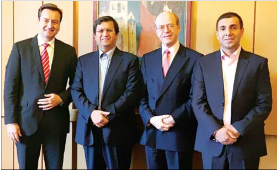
های توسعه اقتصادی کشور و بازار در حال خواستار سرمایه گذاری و حضور بیمه گران گسترش صنعت بیمه ایران ارائه کرد و اروپایی بویژه مونیخ ری برای ارائه پوشش شد. حضور دکتر ویننگ جانشین رئیس

کل درآمد مونیخ ری در سال ۲۰۱۵ معادل ۵۰ میلیارد یورو بود که از آن ۲۹ میلیارد یورو حق بیمه اتکایی، ۱۶ میلیارد یورو درآمد بیمه مستقیم از طرف شرکت ارگو و ۵ میلیارد یورو نیز حق بیمه در رشته درمان بوده است. همچنین سود شرکت در سال پیش ۳٫۵ میلیارد یورو و دارایی شرکت مونیخ ری ۲۷۶ میلیارد دلار است.