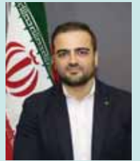
کد مطلب: ۸۰۳۸۰

ارزیابی جنابعلی از وضعیت بازار فعلی رنگ و رزین، پوشش های صنعتی و کامپوزیت در سال های ۹۵ و ۹۶ چیست؟ انظر ما بهتر از سال های گذشته می باشد چراکه امکان تهیه مواد اولیه خیلی راحت تر می باشد. لطفاً آسانی از میزان تولیدات، واردات و سهم صادرات رنگ و رزین، پوشش های صنعتی و کامپوزیت ارائه دهید.