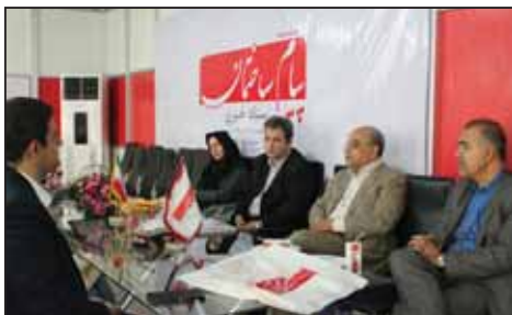
دکتر شیبانی رئیس دفتر تشکل های وزارت راه و شهرسازی