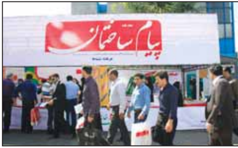
غرفه پارسا در ب جنوب غربی شانزدهمین نمایشگاه صنعت ساختمان