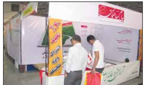
نمایشگاه صنعت ساختمان قائم شهر