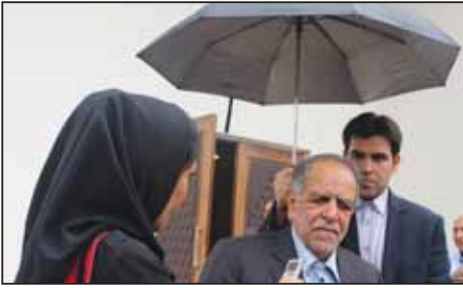
همایش مهندسی شهرسازی