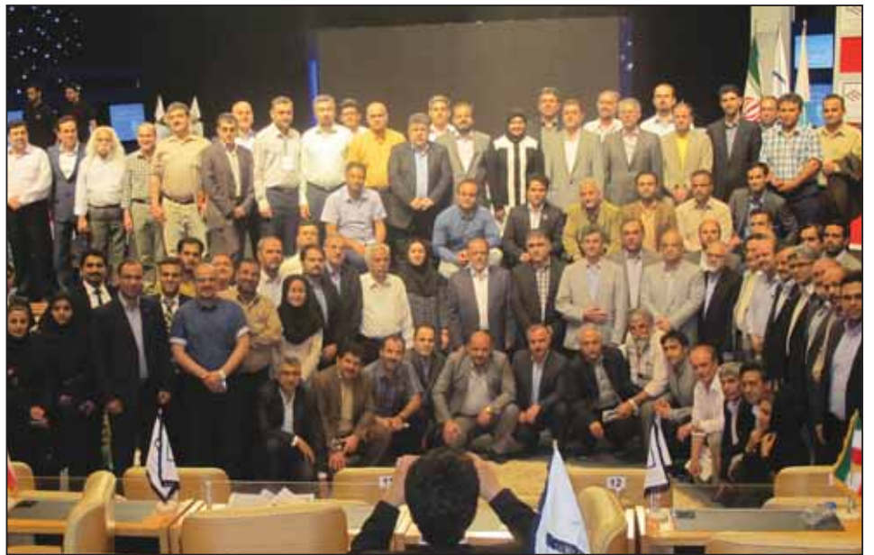
نوزدهمین اجلاس نظام مهندسی کشور