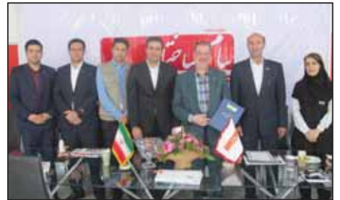
مهدی مودن رئیس سازمان نظام کاردانی ساختمان تهران