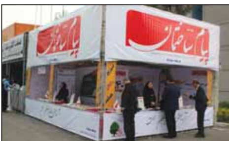
نمایشگاه تاسیسات تهران