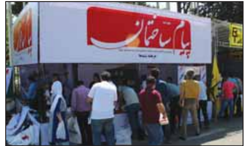
غرفه پارسا در ب شمال شانزدهمین نمایشگاه صنعت ساختمان