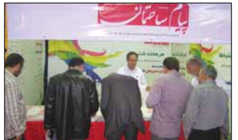
نمایشگاه صنعت ساختمان اردبیل