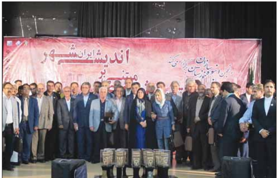
همایش انبوه سازان استان خوزستان