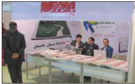
نمایشگاه صنعت ساختمان کرمان