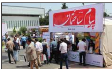
غرفه پارکینگ درب جنوب شناژدهمین نمایشگاه صنعت ساختمان