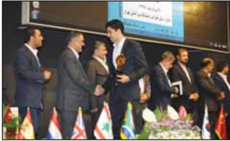
همایش برترین های صنعت ساختمان