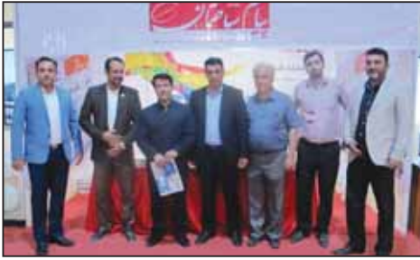
نمایشگاه صنعت ساختمان گلستان