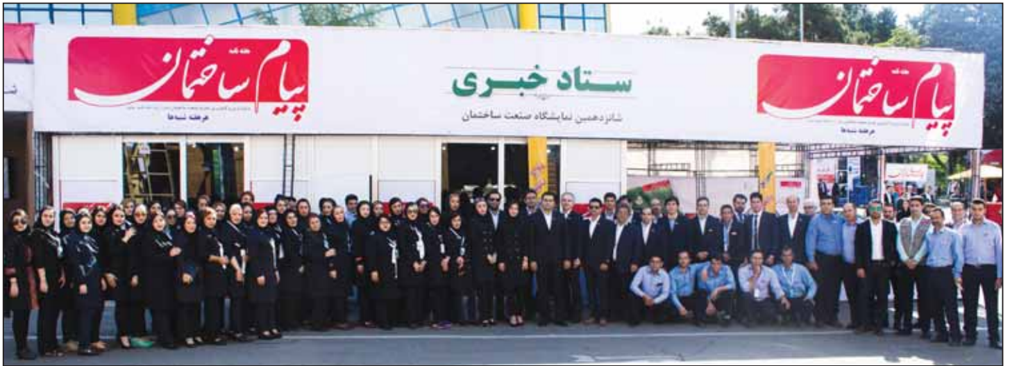
ستاد خبری هفته نامه پیام ساختمان در شانزدهمین نمایشگاه صنعت ساختمان