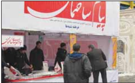
نمایشگاه در و پنجره- تهران