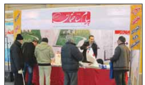
نمایشگاه صنعت ساختمان قزوین