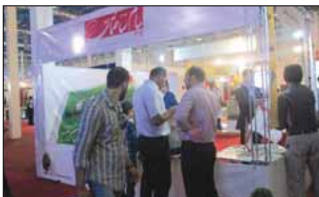
نمایشگاه صنعت ساختمان مشهد