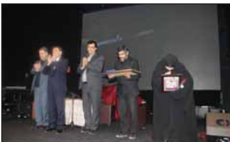
همایش پاسداشت شهید مهندس آتش نشان پلاسکو