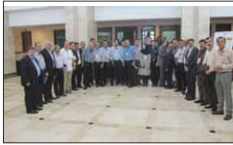
نوزدهمین اجلاس نظام مهندسی