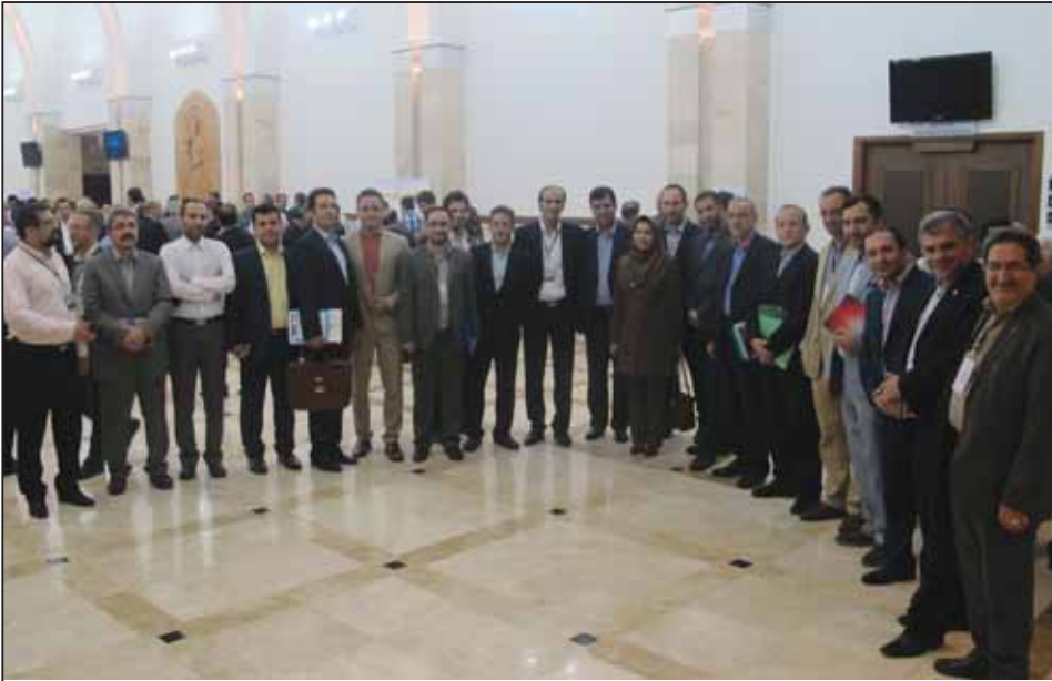
نوزدهمین اجلاس نظام مهندسی