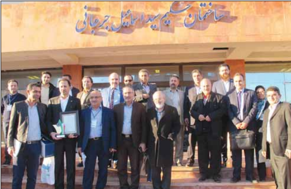
همایش انبوه سازان استان گلستان