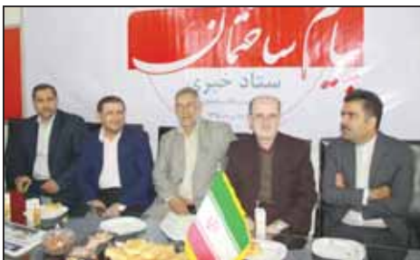
مهرداد بانوج لاهوتی عضو کمیسیون برنامه بودجه مجلس