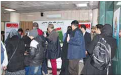
همایش جشن گرامیداشت مقام مهندس