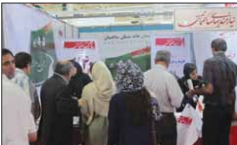
نمایشگاه آب و فاضلاب تهران