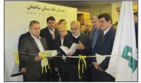
همایش انبوه سازان استان تهران