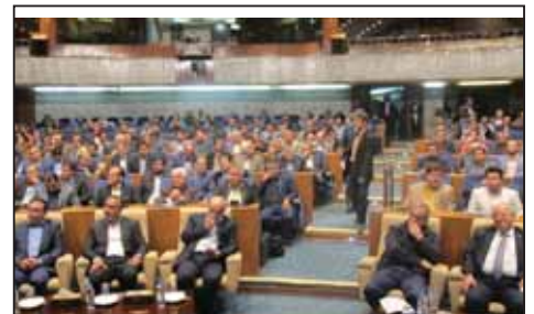
همایش روز جهانی اسکان بشر