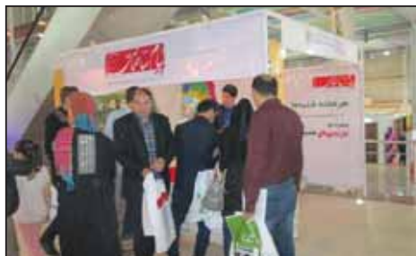
نمایشگاه صنعت ساختمان ارومیه