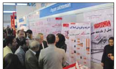
چهارمین نمایشگاه املاک و مستغلات تهران