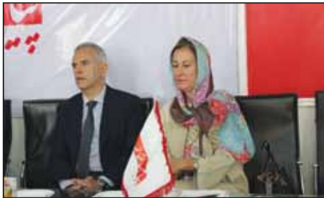
ادواردو لوپس بوستکتس سفیر اسپانیا در تهران