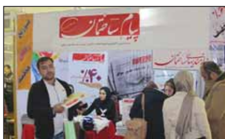
نمایشگاه میدکس تهران