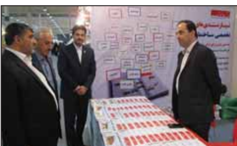
دوازدهمین نمایشگاه عمران و ساختمان کیش