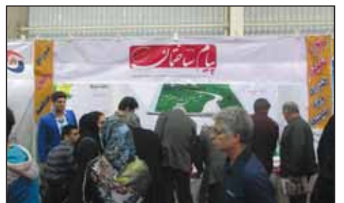
نمایشگاه صنعت ساختمان اصفهان