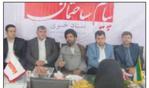
موسوی لارگانی نایب رئیس کمیسیون اقتصادی مجلس