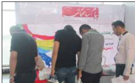
نمایشگاه صنعت ساختمان زنجان