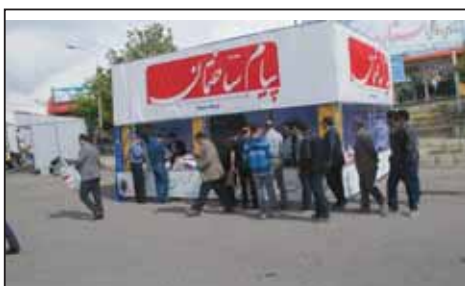
بیست و یکمین نمایشگاه صنعت ساختمان تبریز