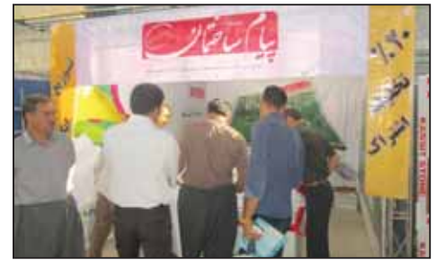
نمایشگاه صنعت ساختمان کرمانشاه