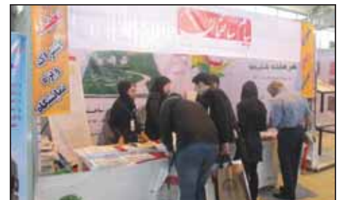
نمایشگاه صنعت ساختمان اراک