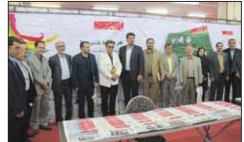
نمایشگاه صنعت ساختمان همدان