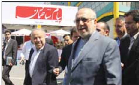
نعمت زاده وزیر صنعت معدن و تجارت