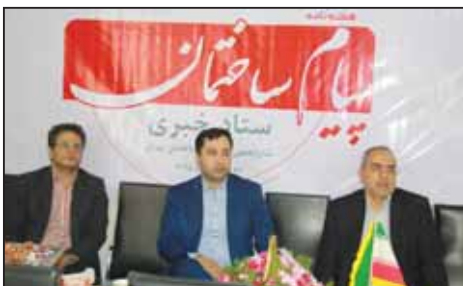
مهندس بیطرف رئیس سازمان نظام مهندسی ساختمان تهران