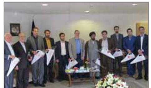
همایش اقتصاد مقاومتی، اقدام و عمل