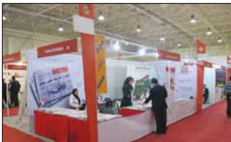
نمایشگاه رنگ و رزیان تهران