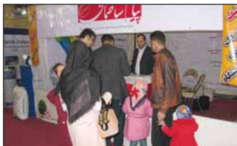
نمایشگاه کاشی و سرامیک یزد