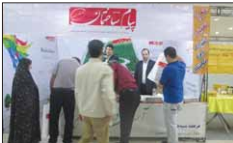
نمایشگاه صنعت ساختمان بندرعباس