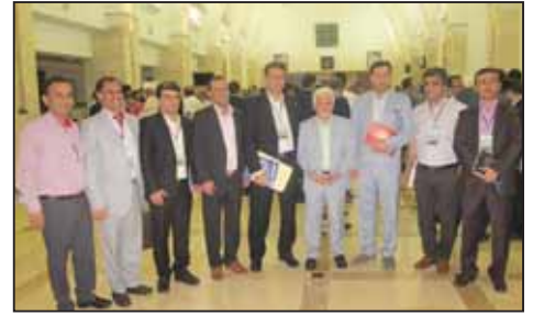
نوزدهمین اجلاس نظام مهندسی