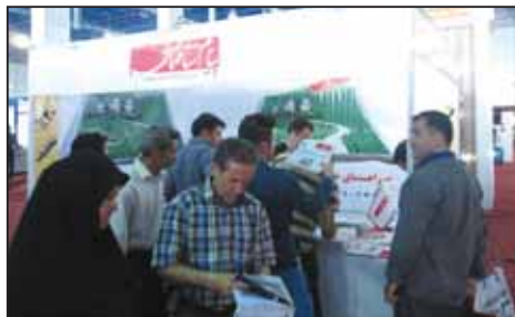
نمایشگاه صنعت ساختمان قم