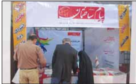
نمایشگاه تاسیسات سرمایش و گرمایش شیراز