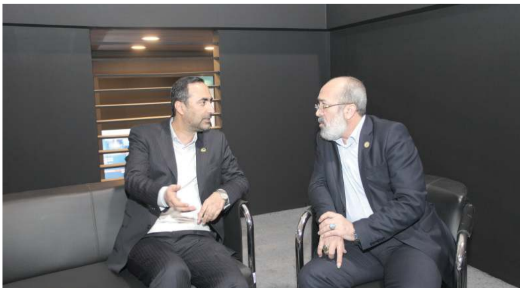
وی با اشاره به راهاندازی واحد اولفین ایلام، ادامه داد: از آنجا که خوراک اصلی واحد پلی‌اتیلن، اولفین است، ما در دستور کار خود تسریع

به گفته اشرف‌زاده تکمیل زنجیره ارزش چهار مزیت دارد که از جمله آن‌ها می‌توان به سرمایه‌گذاری پایین و رغبت بخش خصوصی در مشارکت برای تامین مالی و عدم نیازمندی به نیروهای متخصص با سطح بالا اشاره کرد. همچنین ارزش افزوده بالا و نرخ قابل قبول بازگشت سرمایه در این طرح‌ها از دیگر مزایای تکمیل زنجیره ارزش صنایع پایین‌دست پتروشیمی است.