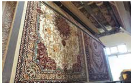
توانستیم با توسعه این صنعت در کشور، محصولات متناسب با سلیقه