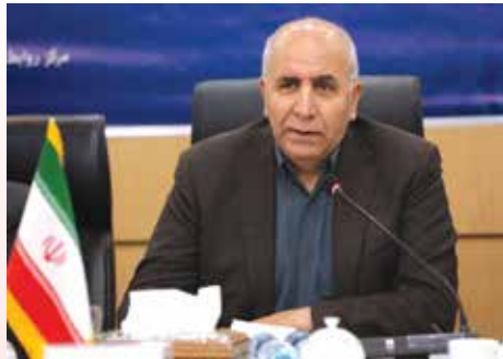
جعفر سرقینی سرپرست وزارت صنعت، معدن و تجارت پیرو نامه

مجلس به دنبال اصلاح قانون بهبود مستمر فضای کسب و کار است